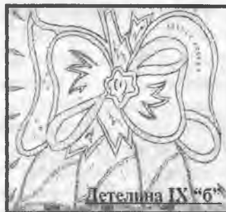
Детелина IX "6"