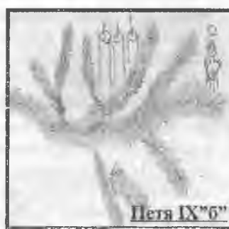
Петя IX "6"