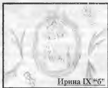
Ирина IX "6"