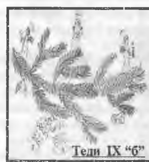
Тели IX "6"