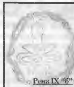
Рени IX "6"