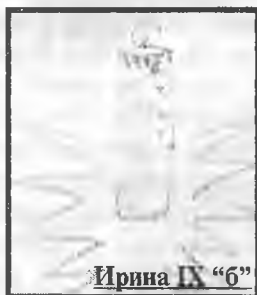
Ирина IX "6"