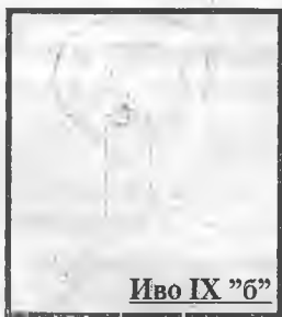
Иво IX "6"