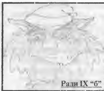
Ради IX "6"