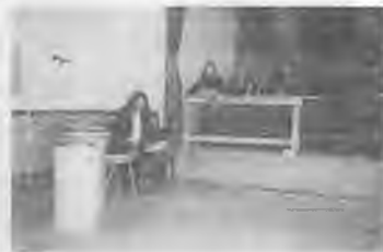
Съдът в състав: съдебни заседатели – Пенка и Мария и съдия Гинка Мечкарова Вляво - машинописка на делото - Цветомира от 12а