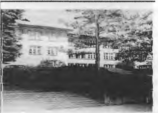
.... и сега !

Юбилейно Стопи ли със ръка от нежност смега от швейта сараята пролетта и птиците се вояват във онездата, от твоя праг изгнана по света едно сияст мълк. и гургурият сто. Но те напусна светът от после, ут остана от левки и пелкав. Ти давали му в очите испри смети и ти налявали. и ладите прила да колит недростатни предеги.