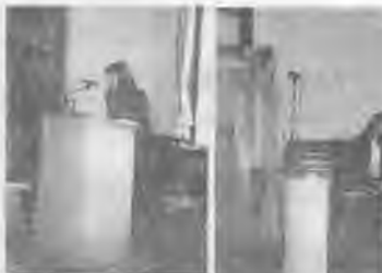
Ефектина Парникова (Боряна 10б), Изменила климата на планетата Земя